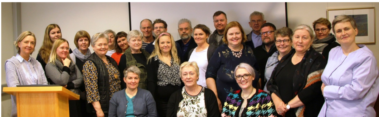
Þátttakendur á ráðstefnu skjalavarda á Sauðárkróki. Mynd frá Héraðsskjalasafninu á Akureyri.

Bára sat kynningarfund Persónuverndar um nýja löggjöf um persónuvernd og vinnslu persónuupplýsinga. Fundurinn var haldinn á Egilsstöðum 5. nóvember.